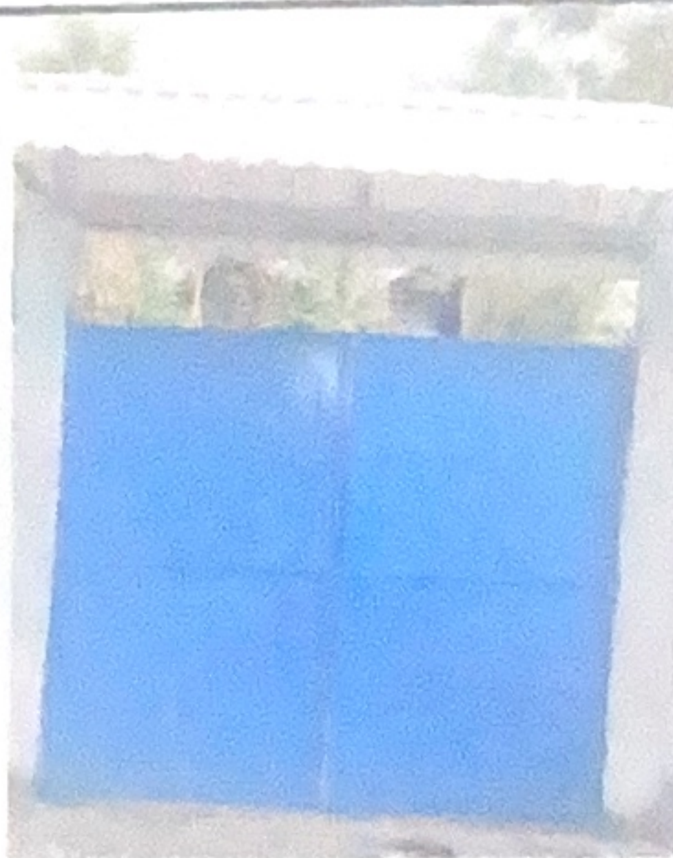
Cambio de puerta principal y entechado.