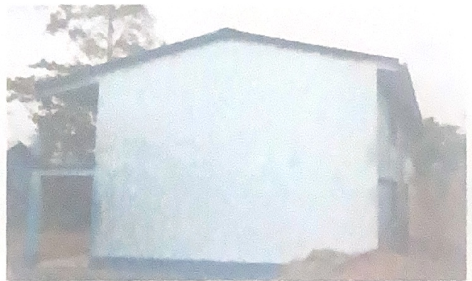
Cambio de canal.

Observación: Si es necesario se pueden agregar hojas adicionales y actualizar el número de hojas.