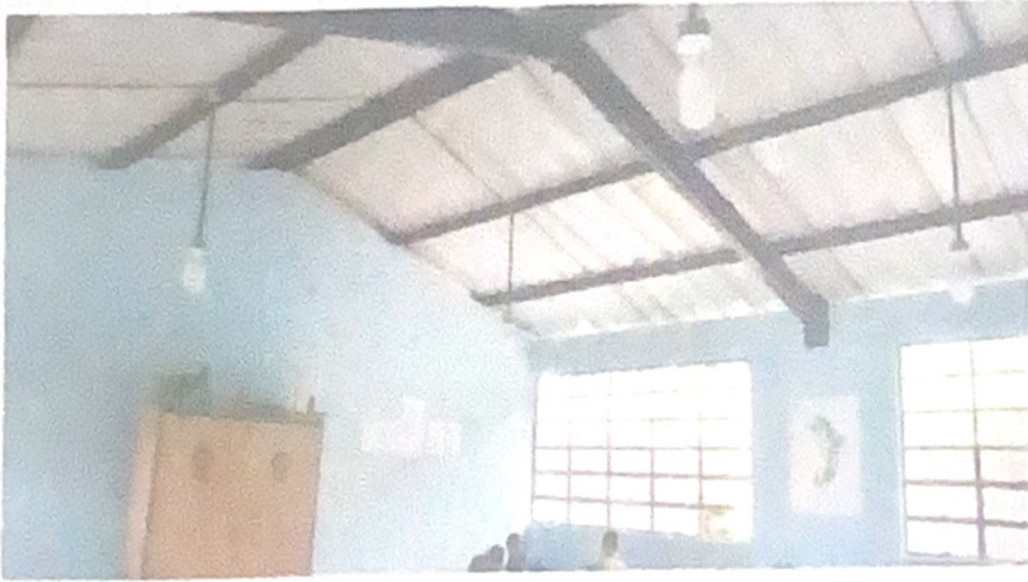
Cambio de sistema eléctrico, primer nivel y segundo nivel.