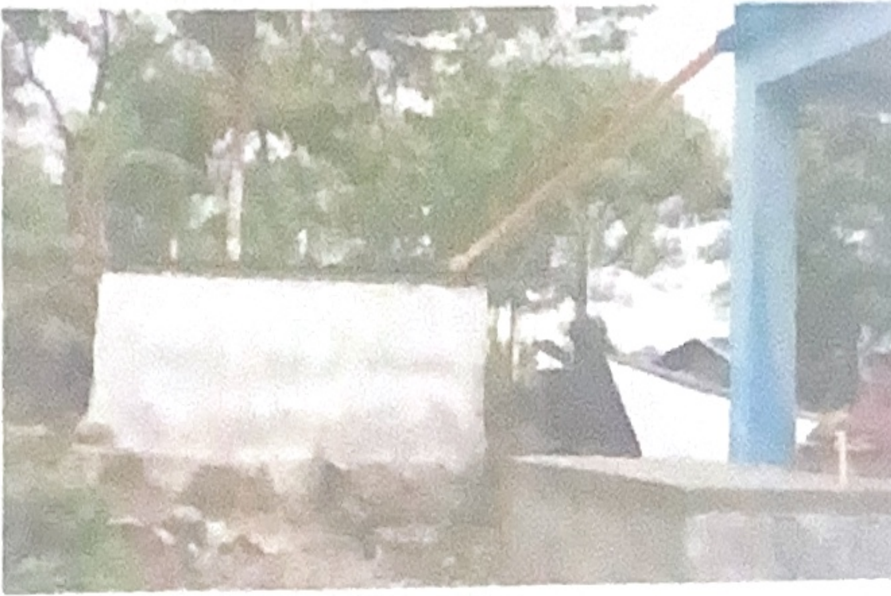
Reparación y mantenimiento de sistemas, depósitos de agua