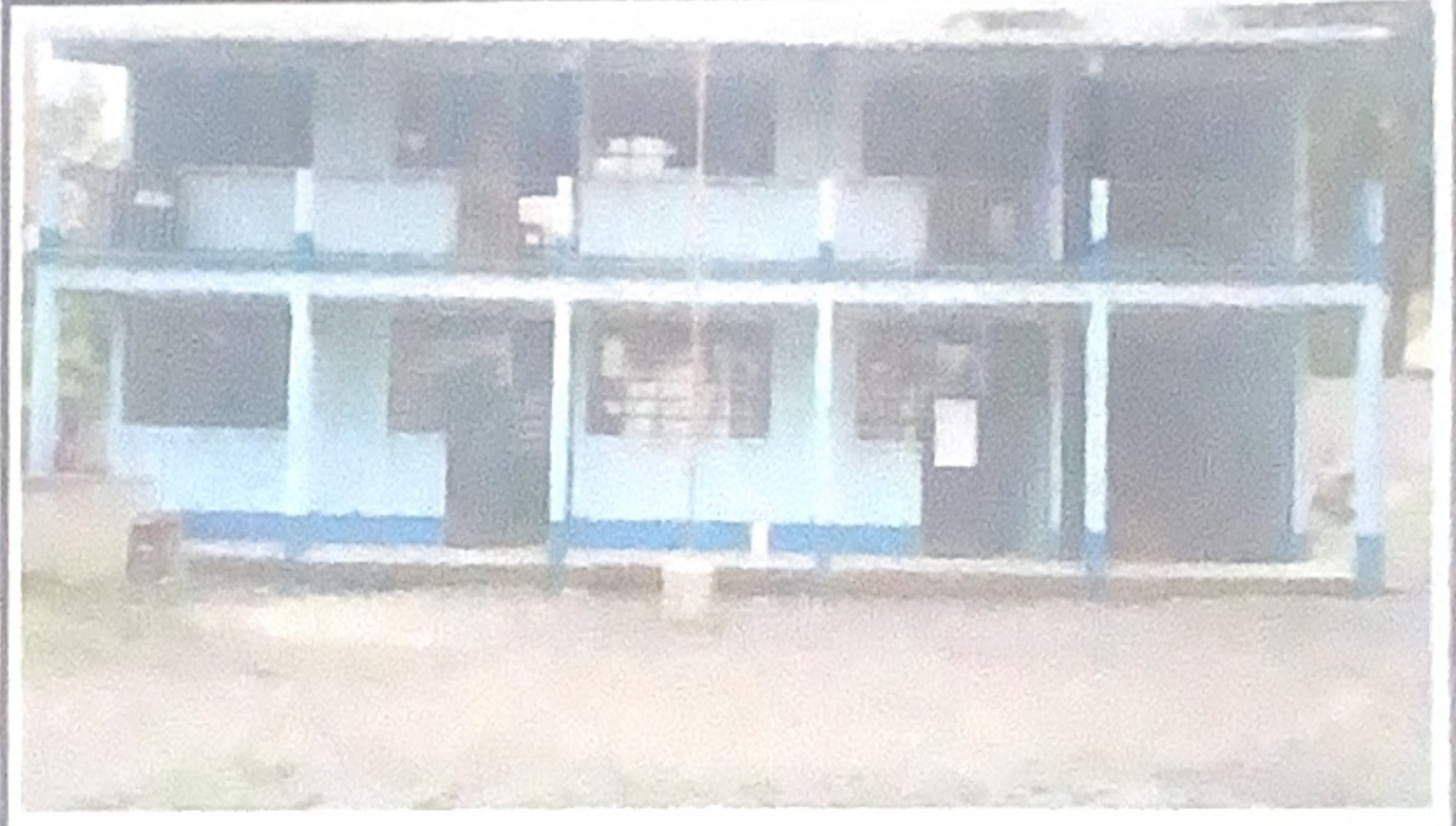
Pintar la escuela exterior e interior, primer y segundo nivel.